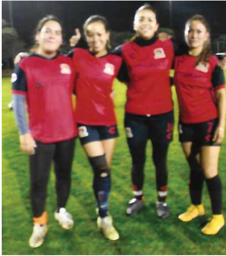
4 goleadoras del equipo Puga Femenil vencieron 4-1 a Cruz Azul el pasado Viernes.