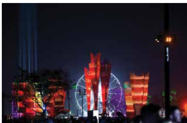
Festival de Música y Artes del Valle de Coachella 2024 - Fin de semana 1 - Día 1 Se ven instalaciones de arte durante el Festival de Música y Artes del Valle de Coachella 2024 en el Empire Polo Club el 12 de abril de 2024 en Indio, California.