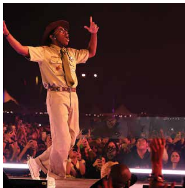
Festival de Música y Artes del Valle de Coachella 2024 - Fin de semana 1 - Día 2 Tyler, the Creator actúa en el escenario de Coachella durante el Festival de Música y Artes del Valle de Coachella 2024 en el Empire Polo Club el 13 de abril de 2024 en Indio, California.