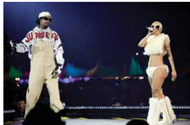
Festival de Música y Artes del Valle de Coachella 2024 - Fin de semana 1 - Día 3 (De izquierda a derecha) 21 Savage y Doja Cat actúan en el escenario de Coachella durante el Festival de Música y Artes del Valle de Coachella 2024 en el Empire Polo Club el 14 de abril de 2024 en Indio, California.