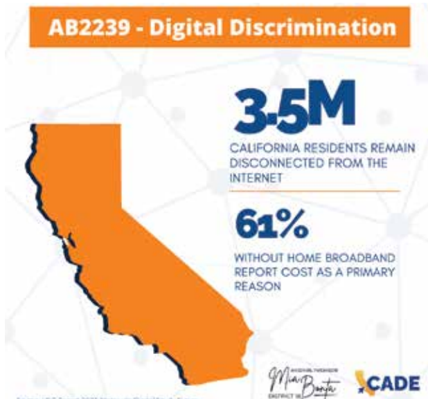
Source: USC Report 2023 Improving Digital Equity Survey

El alto costo de conectarse es una de las principales causas de la brecha digital, y los californianos pagan más por Internet que en cualquier otro lugar del país, a pesar de tener acceso de los mismos proveedores importantes. Los patrones de inversión que impiden que las comunidades de bajos ingresos y de color se beneficien de las redes modernas también exacerbaban la brecha digital. Ambos pueden atribuirse a prácticas comerciales discriminatorias por parte de los mayores proveedores de servicios de Internet (ISP), que priorizan el desarrollo y la mejora de la infraestructura de banda an-