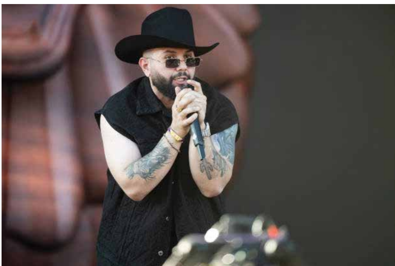
Festival de Música y Artes del Valle de Coachella 2024 - Fin de semana 2 - Día 3 El cantante Carin Leon actúa en el escenario durante el fin de semana 2 - Día 3 del Festival de Música y Artes del Valle de Coachella en el Empire Polo Club el 21 de abril de 2024 en Indio, California.