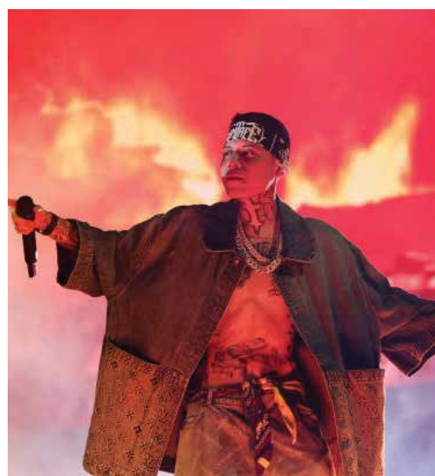
Festival de Música y Artes del Valle de Coachella 2024 - Fin de semana 1 - Día 1 Santa Fe Klan actúa en el escenario de Coachella durante el Festival de Música y Artes del Valle de Coachella Valley 2024 en el Empire Polo Club el 12 de abril de 2024 en Indio, California.