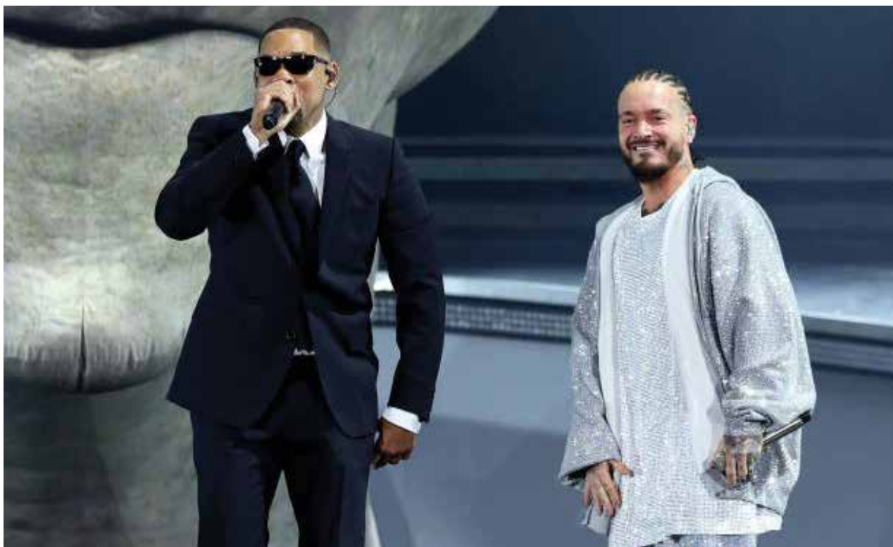
Festival de Música y Artes del Valle de Coachella 2024 - Fin de semana 1 - Día 3 (De izquierda a derecha) Will Smith y J Balvin actúan en el escenario de Coachella durante el Festival de Música y Artes del Valle de Coachella 2024 en el Empire Polo Club el 14 de abril de 2024 en Indio, California.