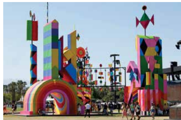
Festival de Música y Artes del Valle de Coachella 2024 - Fin de semana 1 - Día 1 Los asistentes al festival asisten al Festival de Música y Artes de Coachella Valley 2024 en el Empire Polo Club el 12 de abril de 2024 en Indio, California.