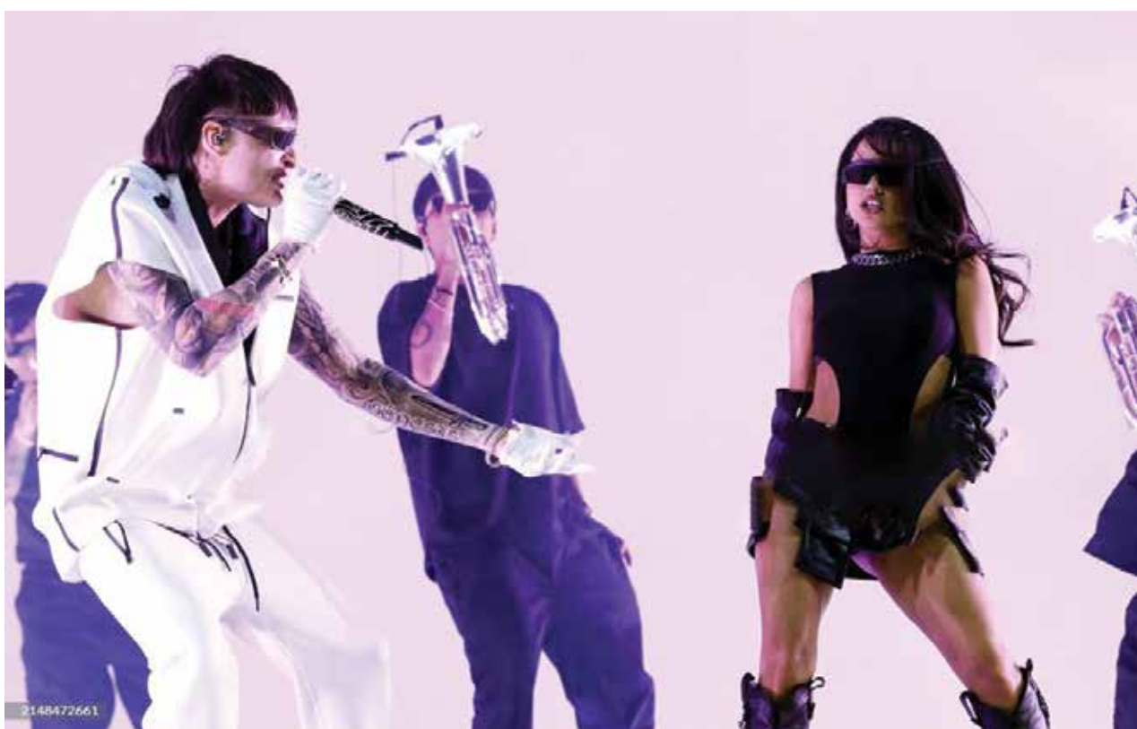
INDIO, (De izquierda a derecha) Peso Pluma y Becky G actúan en el escenario de Coachella durante el Festival de Música y Artes del Valle de Coachella 2024 en el Empire Polo Club el 12 de abril de 2024 en Indio, California.