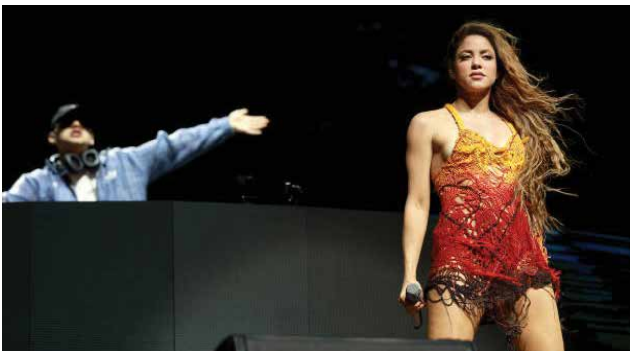
(De izquierda a derecha) Bizarrap y Shakira actúan en Sahara Tent durante el Festival de Música y Artes del Valle de Coachella 2024 en el Empire Polo Club el 12 de abril de 2024 en Indio, California.