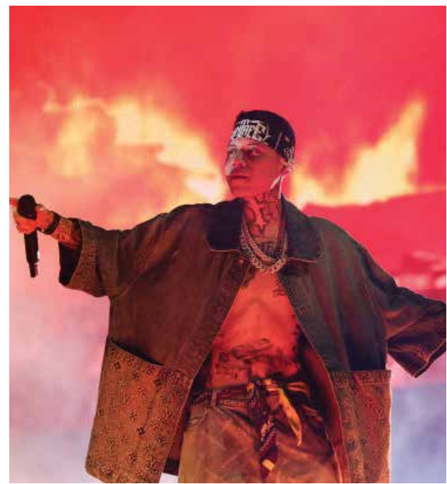
Festival de Música y Artes del Valle de Coachella 2024 - Fin de semana 1 - Día 1 Santa Fe Klan actúa en el escenario de Coachella durante el Festival de Música y Artes del Valle de Coachella Valley 2024 en el Empire Polo Club el 12 de abril de 2024 en Indio, California.