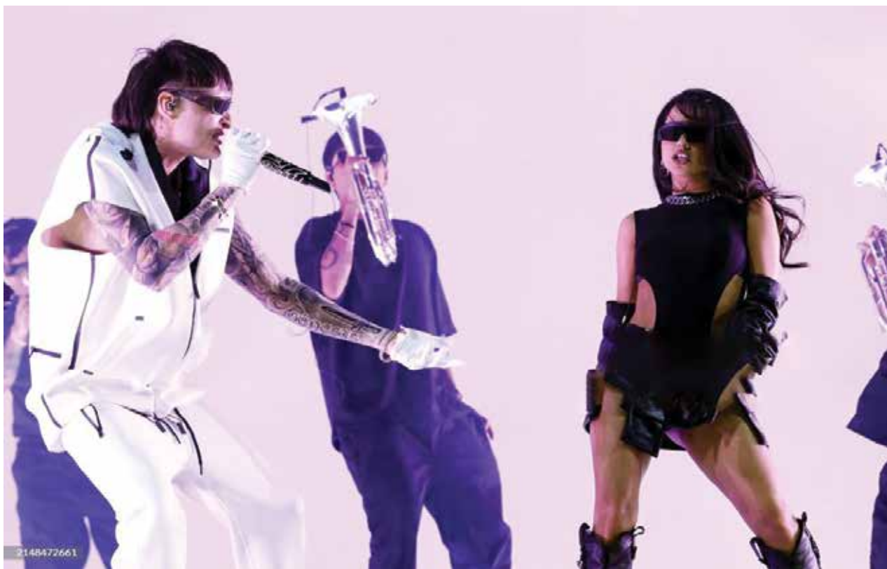
INDIO, (De izquierda a derecha) Peso Pluma y Becky G actúan en el escenario de Coachella durante el Festival de Música y Artes del Valle de Coachella 2024 en el Empire Polo Club el 12 de abril de 2024 en Indio, California.