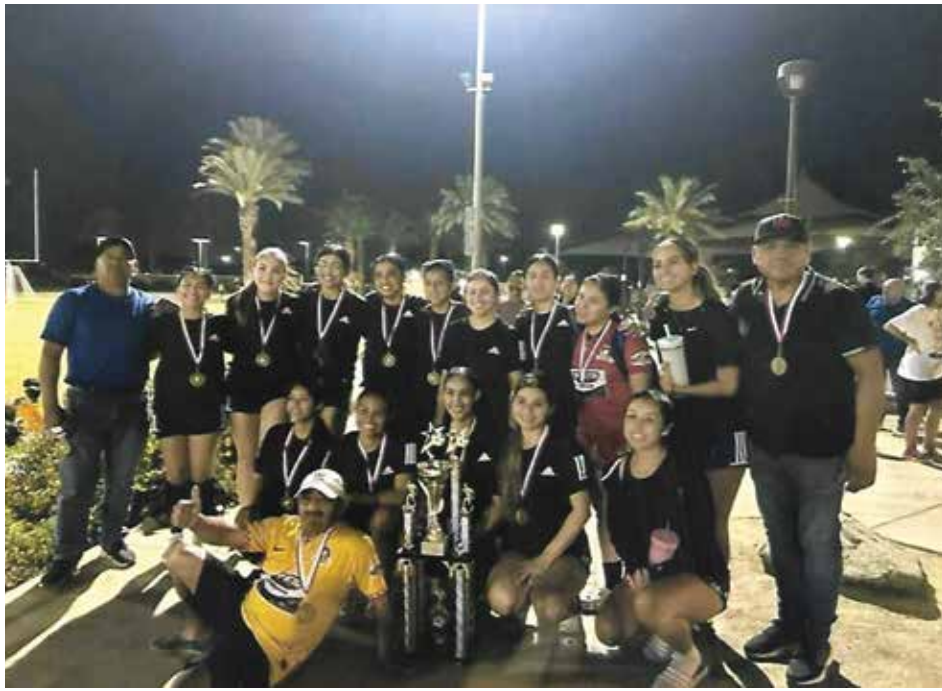
Liverpool femenino campeonas del torneo de verano de la categoría de la Liga CYSA .