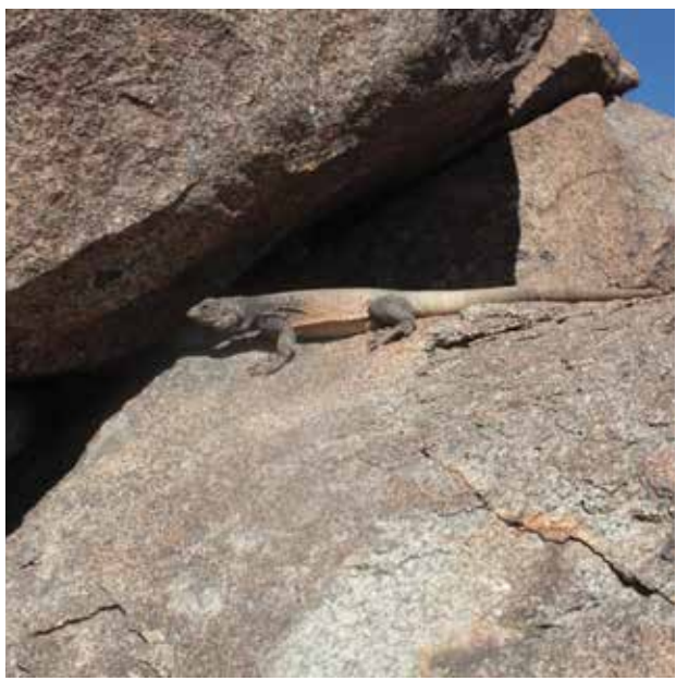
Valle de Coachella protectchuckwalla.org