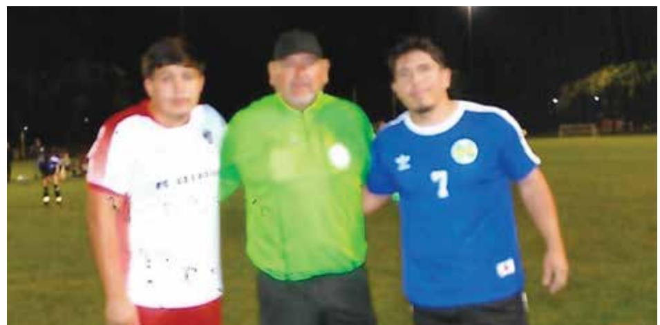
Capitanes de ambas escuadras