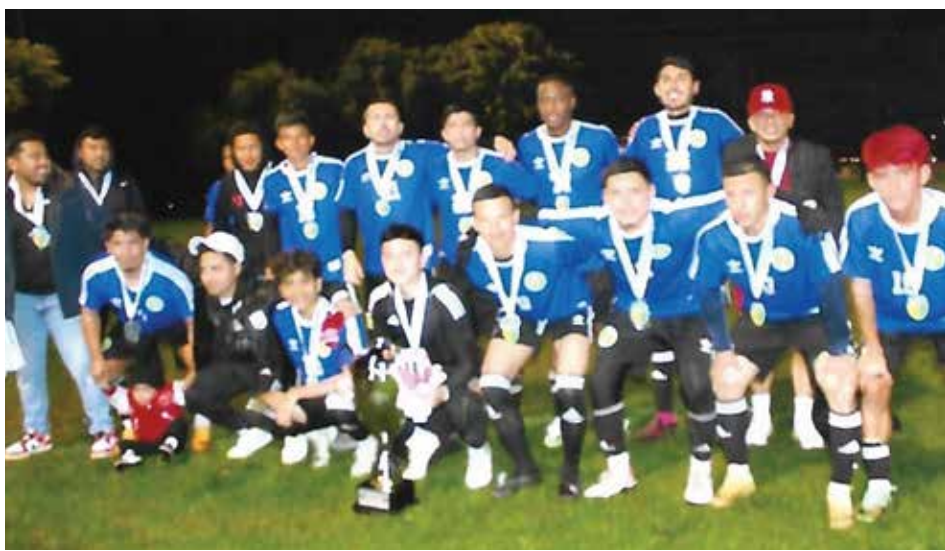
Super Campeones obtuvieron una vez más el Campeonato de esta máxima categoría de la liga de Coachella con marcador de 5-2

Con un categórico 5-2 Super Campeones obtuvieron el campeonato de la máxima categoría de la C.V.S.L (liga vieja), el partido fue jugado en la cancha No.1 del Parque Rancho Las Flores el pasado viernes a las 8pm.