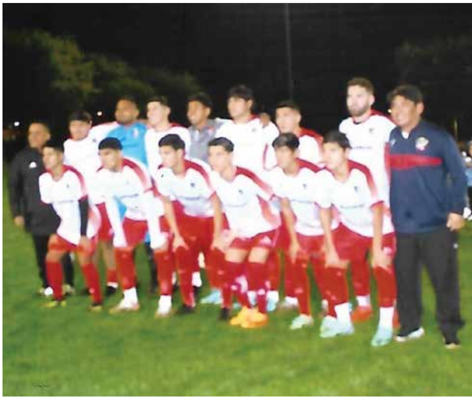
Arandas Sub Campeón de esta categoría de segunda fuerza, cayeron 5-2 en la final