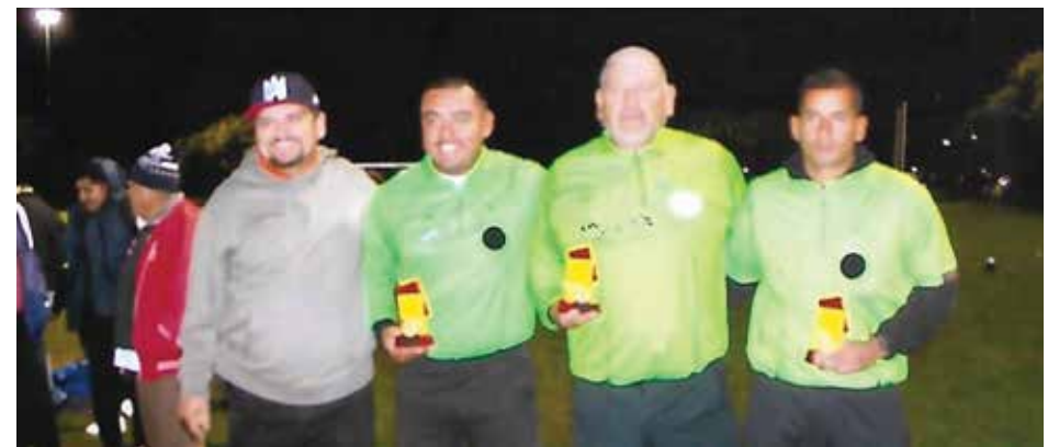
Arbitraje de lujo para este encuentro de buen nivel amateur