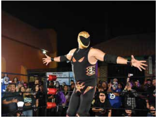
Continúa de página 1

Encabezando el festival de este año se encuentra una presentación en vivo