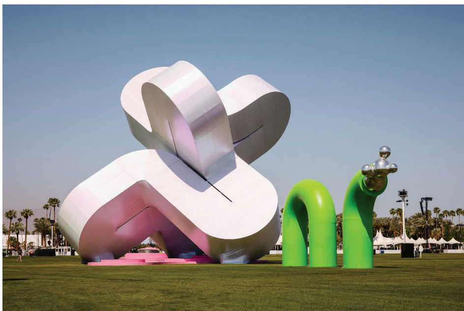
Vista de la instalación del Festival de Música y Artes del Valle de Coachella 2023 de Güvenç Özel, Holoflux , foto de Lance Gerber, cortesía de Coachella

Coachella Art Studios, dirigido por mujeres, of