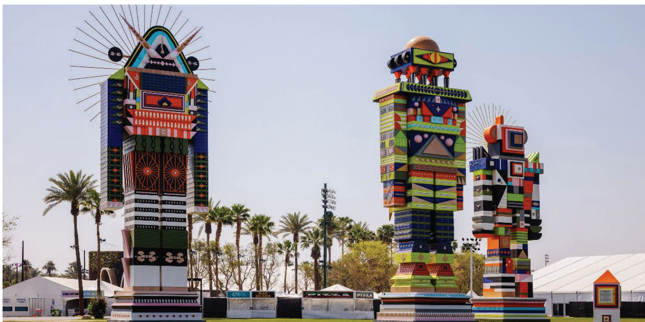
Coachella Valley Music and Arts Festival 2023 vista de instalación de Kumkum Fernando, The Messengers

Desde figuras totémicas que se elevan a lo largo de la extensión del Empire Polo Field hasta móviles flotantes lúdicos e instalaciones basadas en fotografías e intervenciones digitales, las instalaciones masivas de una lista seleccionada de talentos creativos complementan estructuras como Spectra, el pabellón de inspiración arquitectónica de siete pisos., la cadena cinética