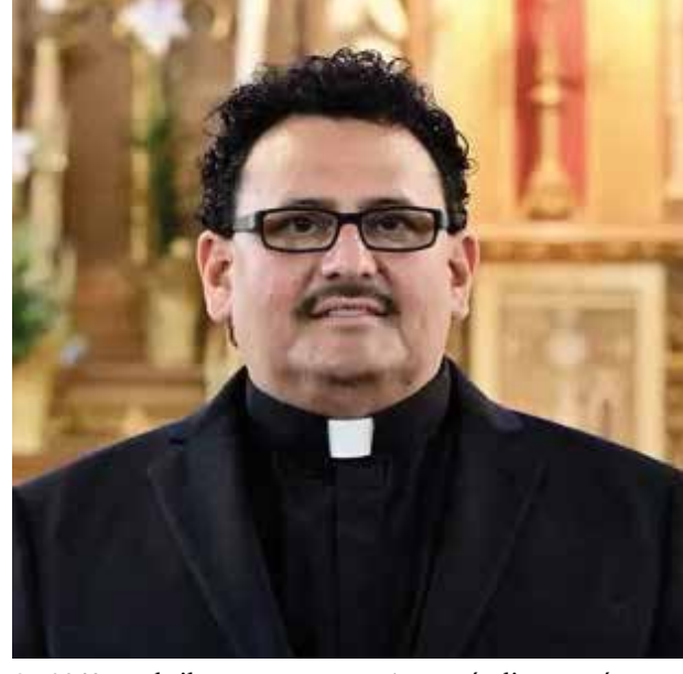
SB 2340 en abril.

Las comunidades de todo el país están sintiendo el impacto del lenguaje a menudo hostil y racista que proviene de los líderes políticos, incluido Donald Trump, quien ha propuesto llevar a cabo una deportación masiva de millones de inmigrantes, así como de candidatos de cargos más bajos. Aquí en el Valle de Coachella, la organización comunitaria TODEC, que brinda servicios legales y de otro